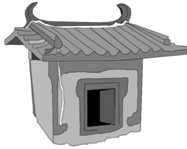
Abb. 1. Gebäudemodell, gebrannter Ton. L=28,6; T=24,2; H=38 cm. Fundort: Grab M10, Yunpolu 云波路, Datong, Prov. Shanxi. Nördliche Wei-Dynastie, ca. 5. Jh. Zeichnung: Fiona Pinnow nach Datong shi kaogu yanjiusuo 2017, Abb. 30.

Gemäß dem Vergleich mit den oben genannten Abbildungen und Modellen darf sie wohl auch für buddhistische Gebetshallen aus zwei-drei vorangehenden Jahrhunderten gelten. 34 Auch tönerner Grabmodelle aus den 5. bis 6. Jh. in Datong und Zhengzhou könnten demnach mit dem Buddhismus in Verbindung stehen. Nachvollziehbar ist zumindest, dass die buddhistisch beeinflussten Toba-Xianbei und die Han der Sui-Zeit sie als Modelle von Gebetshallen und Orten der Meditation (also nicht von Wohnräumen) für Bestattungen herstellen ließen.