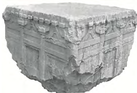
Abb. 2. Gebäudemodell, Fragment einer Gedenksäule, geschnittener Stein. L=97,5; H=76,5cm. Fundort: Zhongshan-Berg, Nanjing, Prov. Jiangsu, Liang-Dynastie, 1. Hälfte 6. Jh. Vektorgrafik nach He Yun'ao 2010, Tafel 16.

Noch ein zweiter Fall sei kurz genannt: Rund 70 km östlich von Nanjing, in Zhenjiang 鎮江 – dort, wo die Liang ihre kaiserliche Münze hatten –, kam ein kleines Fragment eines Stupamodells zum Vorschein. Es besteht aus grauem Ton und ist mit einer Buddha-Figur dekoriert. 37 Dieser Fund weist darauf hin, dass sich Modelle buddhistischer Bauten im Liang-Reich verbreiteten und wohl zum Alltagsleben verschiedener Gesellschaftsgruppen gehörten.