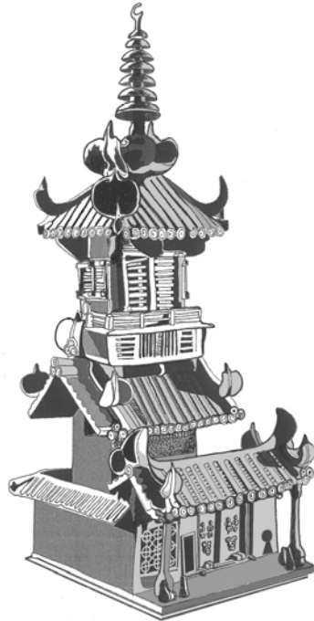
Abb. 5. Turmmodell mit Stupa-Dachaufbauten, gebrannter Ton. L=33; T=31; H=104cm. Fundort: Grab M1, Caiyue 菜越, Xiangfan, Prov. Hubei. 2. Hälfte des 3. Jh. Zeichnung: Fiona Pinnow und Maria Khayutina nach Xiangfan shi wenwu kaogu yanjiusuo 2010, Abb. 12.

dieser Zeit – wenigstens nach Angaben des bereits erwähnten Hui Sheng – etwa dreitausend ausländische Mönche. 54 Durchaus vorstellbar ist, dass zusammen mit ihnen Handwerker eingetroffen waren, die sich der Herstellung buddhistischer Weiheobjekte widmeten. Vielleicht reisten einige von ihnen weiter nach Süden, sei es auf eigenen Antrieb oder im Rahmen diplomatischer Austauschbeziehungen, um ihre Dienste anzubieten. Denkbar ist zudem, dass Kaiser Wu Interesse daran hatte, Modelle der von ihm selbst gestifteten Klosterpagoden anfertigen zu lassen.