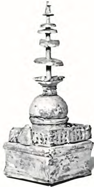
Abb. 4. Stupamodell, Kupfer, vermutlich legiert. H=12,9cm. Fundort: Jaulian-Kloster, Taxila, Gandhāra-Region, Pakistan. Kushan-Reich (1.-3. Jh.), ca. 2.-3. Jh. Vektorgrafik nach The British Museum, Kat.-Nr. 1887,0717.23.

bäumemodelle, so darf man wohl annehmen, konnten bequem auf Reisen mitgenommen werden, wie auch kleine Buddhafiguren; damit dürften sie zur Verbreitung der buddhistischen Ikonografie und Architektur beigetragen haben. 47